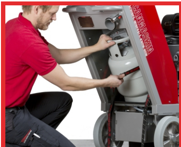
Tanque de propano