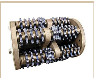
Estrellas EDCO esarificador de carburo tungsteno